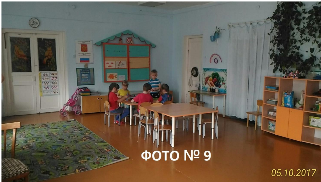
ФОТО № 9