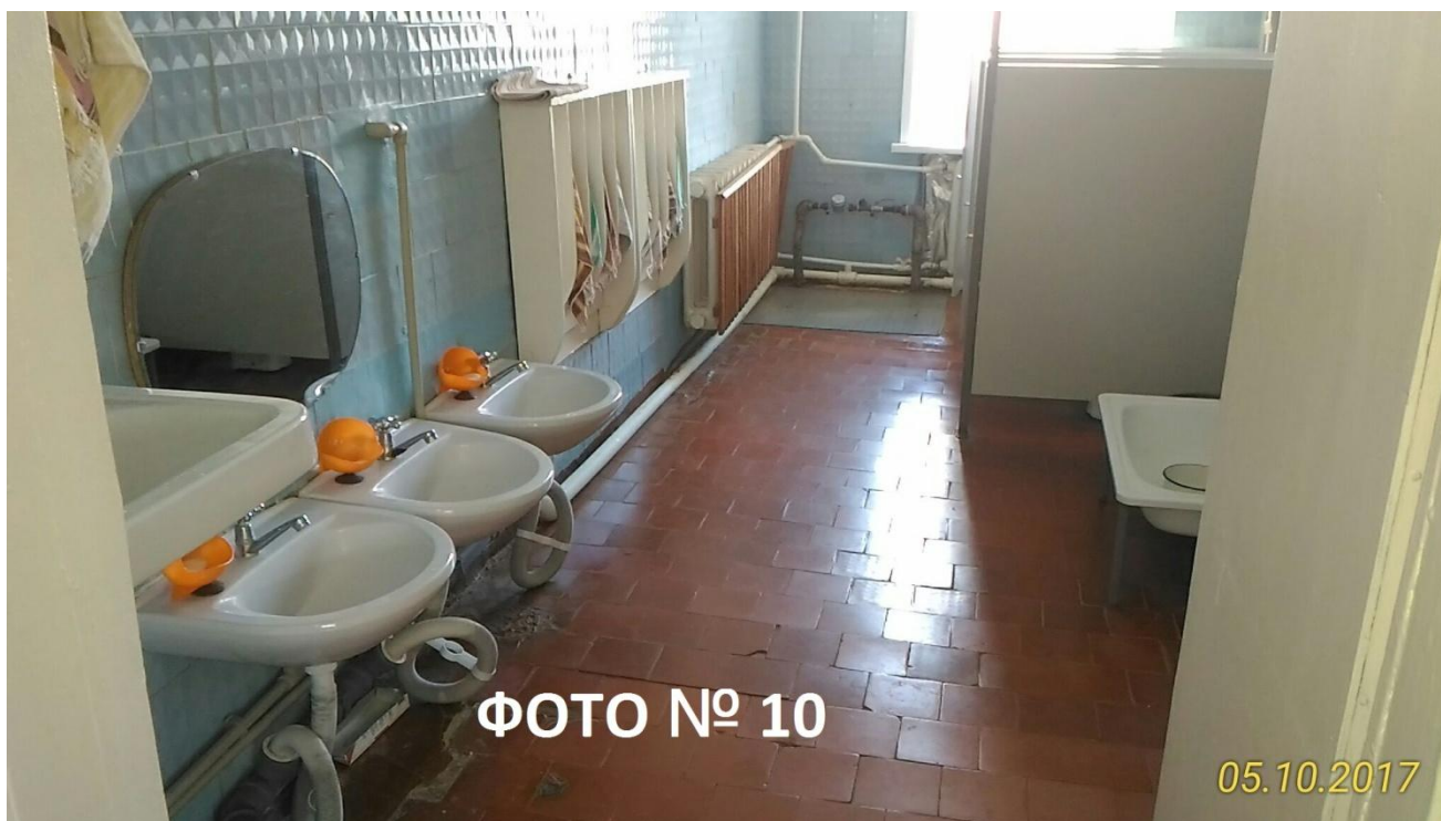
ФОТО № 10